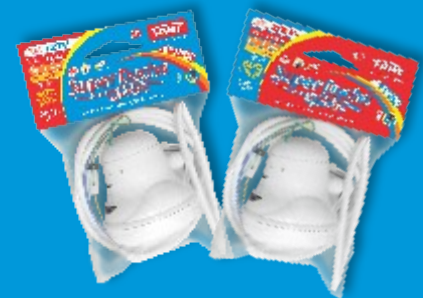
Embalagem Saco Plástico