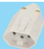
■ 1727 / ■ 1728