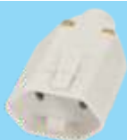
■ 1417 / ■ 1418