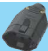
■ 2146 / ■ 2147