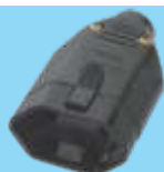
■ 2144 / ■ 2145