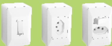
■ 0604 ■ 1413 ■ 1414 ■ 1415 ■ 1416