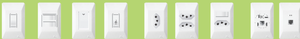
■ 0940 ■ 0941 ■ 0946 / 0947 ■ 0948 ■ 0342 ■ 0942 ■ 1405 ■ 1406 ■ 1407 ■ 1408 ■ 1409 / 1411 ■ 1410 ■ 1412 ■ 0409