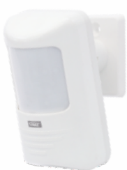
0738 - Articulado