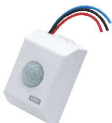
0763 - Para Teto