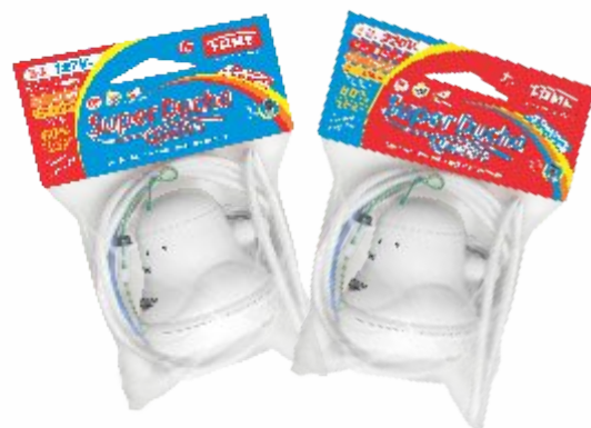
Embalagem Saco Plástico