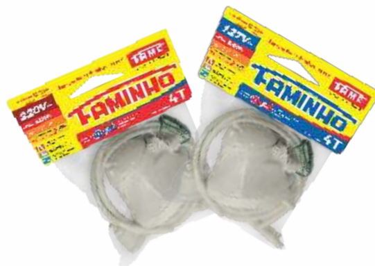
Embalagem Saco Plástico