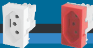
■ 1427 / ■ 1428 ■ 2373 / ■ 2374

Compatíveis com a Série Modulare Compatíveis com a Série Evidence