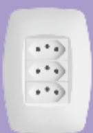
■ 3128 / ■ 3129