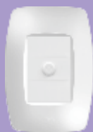
2266 / 2267