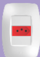
■ 2362 / ■ 2363