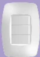
■ 2254 / ■ 2359 ■ 2360 / ■ 2361