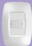
■ 2351 / ■ 2352