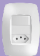
■ 2260 / ■ 2261 ■ 2365 / ■ 2366