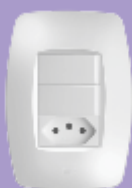
■ 2367 / ■ 2368 / ■ 2369 ■ 2370 / ■ 2371 / ■ 2372