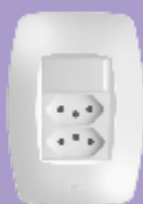
■ 3539 / ■ 3540