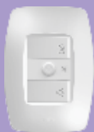
2268 / 2269