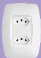
■ 2259 / ■ 2364