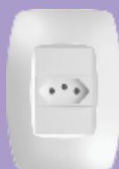
■ 2257 / ■ 2258