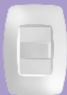
■ 2250 / ■ 2252