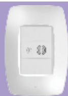
2629 / 2630