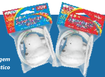
Embalagem Saco Plástico

O Chuveiro elétrico ainda é a maneira mais econômica de se tomar um bom banho quente, com economia de água e energia elétrica. Resistência com garantia de 90 dias.