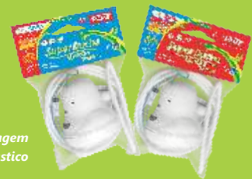
Embalagem Saco Plástico